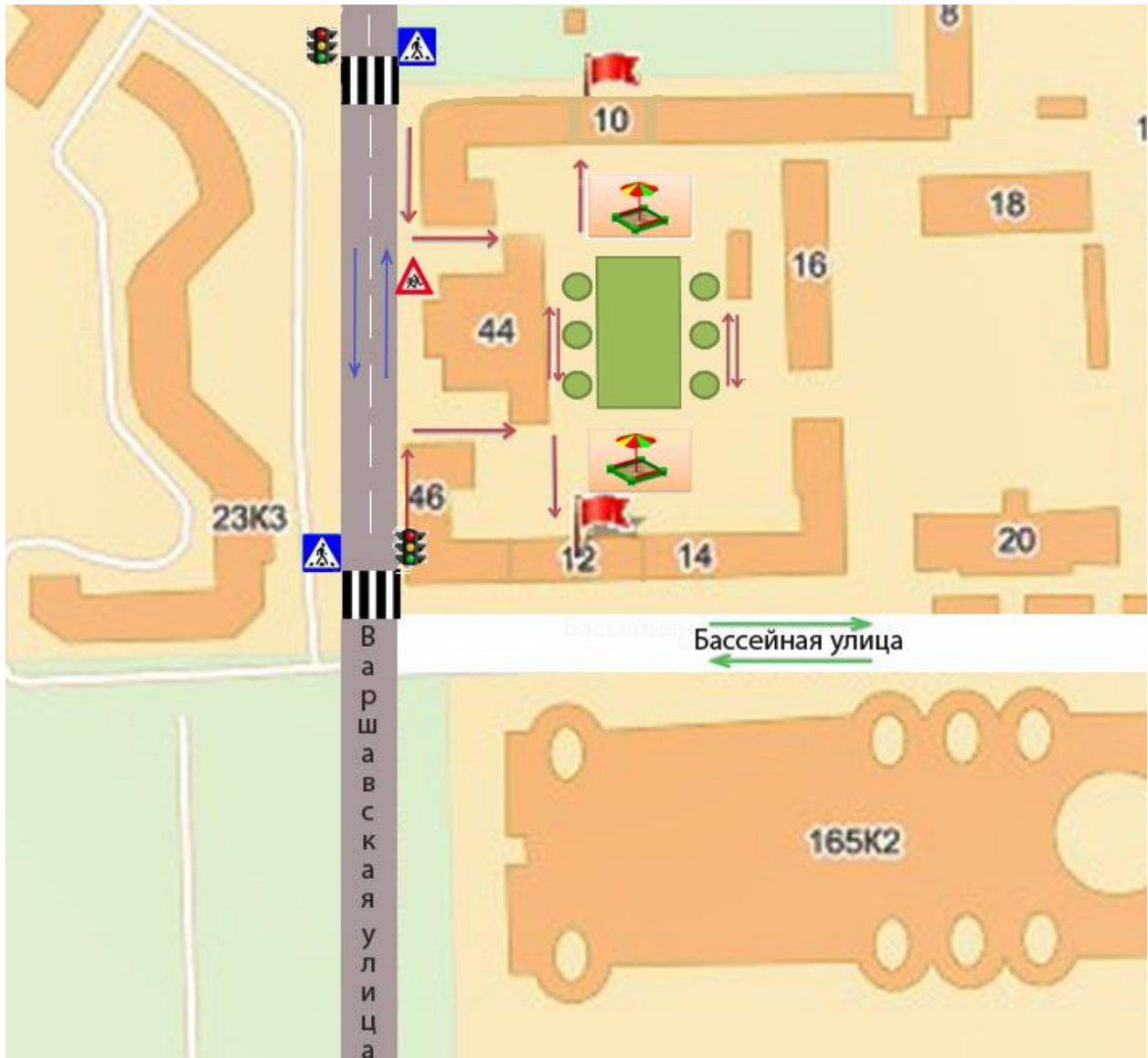
Схема организации дорожного движения в непосредственной близости от образовательного учреждения с размещением соответствующих технических средств, маршруты движения детей и расположение парковочных мест

ГБОУ СОШ №358 ОДО улица Бассейная, дом 12, литер А площадь Чернышевского, дом 10, литер А